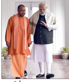
कार रही है. आखिर बदलाव की जरूरत क्यों पड़ी?

लखनऊ. उत्तर प्रदेश की राजनीति में 2027 विधानसभा चुनाव अभी भले दूर दिखाई देता हो, लेकिन भारतीय जनता पार्टी (BJP) ने उसकी तैयारी लगभग युद्धस्तर पर शुरू कर दी है. पार्टी के भीतर चल रही चर्चाओं और हालिया संगठनात्मक गतिविधियों से संकेत मिल रहे हैं कि यूपी बीजेपी में बड़ा फेरबदल होने वाला है. चर्चा यह भी है कि संगठन की लगभग आधी टीम बदली जा सकती है और ऐसे नेताओं को हटाया जा सकता है जो लंबे समय से एक साथ कई पदों पर बने हुए हैं. यह बदलाव केवल चेहरे बदलने का मामला नहीं है, बल्कि 2024 लोकसभा चुनाव में मिले झटके के बाद बीजेपी की उस रणनीति का हिस्सा है जिसके जरिए वह 2027 में सत्ता की हैट्टिक लगाने की तैयारी