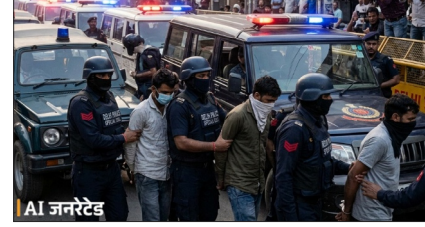
आतंकी मांड्यूल लंबे समय से तैयार किया

पुलिस ने बताया कि ये लोग बड़े आतंकी हमले की साजिश रच रहे थे. इनके निशाने पर दिल्ली, मुंबई के प्रमुख धार्मिक स्थल, सरकारी इमारतें, मंत्रालय और सुरक्षाबल थे. जांच के मुताबिक यह