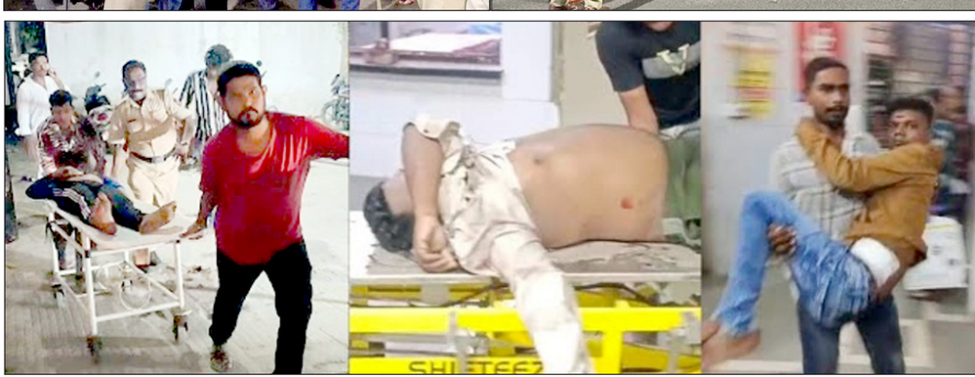
बताया जा रहा है कि गुरुवार शाम को अचानक अंबरनाथ गांव और कैलाश कॉलोनी चौक के गुंडों के बीच पुराने झगड़े की वजह से हाथापाई हो गई है और इस हाथापाई में आरोपियों ने अपनी पिस्तौल