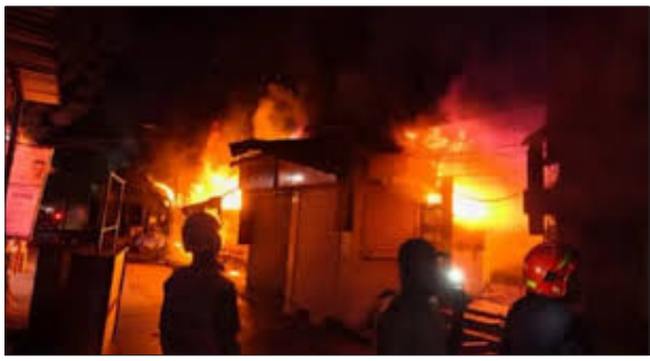
अधिकारियों के अनुसार, आग सुबह करीब 3.45 बजे मार्केट कॉम्प्लेक्स में लगी, जहां बड़ी संख्या में सब्जी, फल और कपड़ों की दुकानें मौजूद थीं। आग की भयानक रूप को देखते हुए फायर विभाग ने 'ब्रिगेड कॉल' घोषित

ठाणे, ठाणे में गुरुवार तड़के उस वक्त हड़कंप मच गया, जब रेलवे स्टेशन के पास स्थित गांवदेवी मार्केट कॉम्प्लेक्स में अचानक भयानक आग लग गई। आग इतनी तेज थी कि दूर-दूर तक आसमान में धुएँ और आग की ऊंची लपटें दिखाई देने लगीं। इस दर्दनाक हादसे में एक दमकलकर्मी (फायरमैन) और एक सुरक्षा गार्ड की जान चली गई है और दो अन्य फायरकर्मी गंभीर रूप से घायल हो