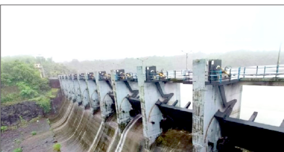
अगले कुछ हफते बेहद अहम

ठाणे. ठाणे जिले में इस साल गर्मी की मार ज़ोरों पर है और इसका सीधा असर अब जिले के पानी सप्लाई सिस्टम पर दिख रहा है। जिले के शहरी और इंडस्ट्रियल इलाकों को पानी सप्लाई करने वाले बारवी डैम में पानी का स्तरोज सिर्फ दो हफ्तों में पाँच परसेंट घटकर 35 परसेंट रह गया है।