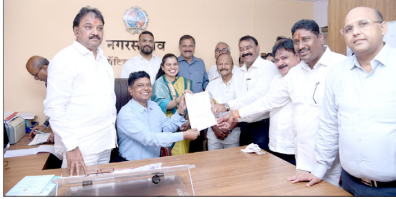
दाखिल होने से सभापति का चयन निर्विरोध होना लगभग तय माना जा रहा है।