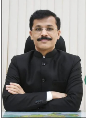
कल्याण विभाग के सचिव के पद पर तैनात किया गया था। मुख्यमंत्री

मुंबई स्थित मंत्रालय में दिव्यांग कल्याण विभाग के सचिव तुकाराम मुंडे का तबादला राज्य सचिवालय में सचिव, आपदा प्रबंधन, पुनर्वास, राजस्व और वन विभाग के पद पर किया गया है। उन्हें अगस्त 2025 में यानी एक साल से भी कम समय पहले दिव्यांग