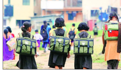
उदासीनता की वजह क्या यह है कि जो बच्चे तस्करी का शिकार हो जाते हैं, उनमें ज्यादातर समाज के गरीब और कमजोर तबके से आते हैं?

हैरानी की बात यह है कि बाल तस्करी के फैलते जाल पर शीघ्र अदालत के सख्त रुख के बावजूद कई राज्यों में अब तक न जल्दी रपट तैयार की है और