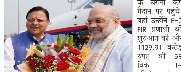
पुष्कर सिंह धामी ने स्वागत किया। इसके बाद वे हेलीकॉप्टर से हरिद्वार

उन्होंने कहा कि उत्तराखंड को अटल बिहारी वाजपेयी ने बनाया था और अब प्रधानमंत्री नरेंद्र मोदी संवार रहे हैं। केदारनाथ धाम से लेकर कन्याकुमारी तक पूरे देश में जहां-जहां घुसपैटिए हैं, उन्हें चुन-चुनकर भारत से बाहर निकालने का काम किया जाएगा। एक दिवसीय दौरे पर उत्तराखंड पहुंचे शाह का देहरादून के जॉलीग्रॉउंट एयरपोर्ट पर सीएम