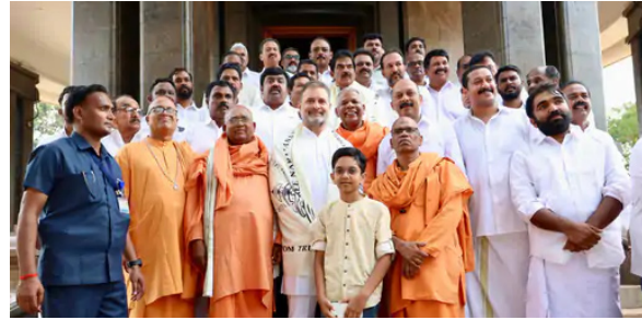
पर हैं। वे टेक्नोपार्क में इन्फॉर्मेशन टेक्नोलॉजी (IT) फ्रेटरनिटी के साथ बातचीत कर रहे थे। इस दौरान उन्होंने चाइना के इंस्ट्रुमेंटल सिस्टम की तारीफ की।

त्रिवेन्द्रम. कांग्रेस सांसद राहुल गांधी ने शनिवार को त्रिवेन्द्रम में कहा कि अगर वे पोलिटिक्स में नहीं होते, तो एयरस्पेस की दुनिया में एंटरप्रेन्योर (कारोबारी) होते। राहुल ने कहा कि वे एक पायलट हैं। उनके पिता और चाचा भी पायलट थे। यह परिवार में चलता है। राहुल केरल के दो दिन के दौरे