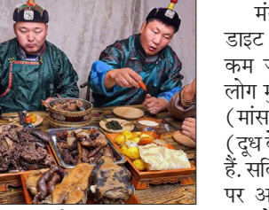
यहां मांस की भरपूर उपलब्धता है, जिससे इसके दाम बहुत कम रहते हैं। सोशल मीडिया पर कई वीडियो वायरल हैं जिनमें दवाव किया गया है कि मंगोलिया में मांस कॉफी से भी सस्ता है। मांस ही है मुख्य भोजन

के कप से भी सस्ता पड़ता है। मंगोलिया वह देश है जहां इंसानों से कहीं ज्यादा पशु हैं और लोग सदियों से मांस-दूध आधारित आहार पर जी रहे हैं। मंगोलिया की आबादी करीब 35 लाख है, लेकिन यहां पशुओं की संख्या 50-70 मिलियन से ऊपर बताई जाती है। यानी हर व्यक्ति पर औसतन 15-20 पशु आते हैं। इसमें भेड़, बकरी, गाय, घोड़े और ऊंट शामिल हैं। ये सब घास के मैदानों में चूमते रहते हैं। नॉमैडिक जीवनशैली के कारण