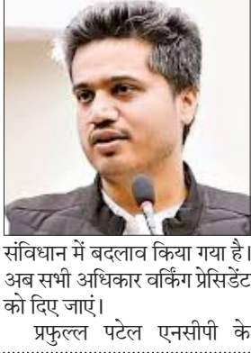
संविधान में बदलाव किया गया है। अब सभी अधिकार वर्किंग प्रेसिडेंट को दिए जाएं। प्रफुल्ल पटेल एनसीपी के