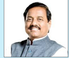
हालांकि बाद में उन्होंने चुनाव आयोग को लेटर लिखा।