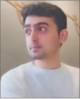
जैसी होती जा रही थीं। ऐसा अंदाजा लगाया जा रहा है कि रेबीज का इंजेक्शन उसके दिमाग तक पहुंचने से उसका दिमागी संतुलन बिगड़ गया होगा।