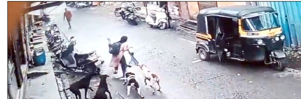
कुत्तों के काटने पर रेबीज के इंजेक्शन दे जगहों पर लगते हैं, कैप नंबर 3 में सेंट्रल गवर्नमेंट हॉस्पिटल और कैप नंबर 4 में गवर्नमेंट मैटर्निटी होम। इन दोनों हॉस्पिटल में रेबीज इंजेक्शन के लिए हर दिन भीड़ रहती है। जब इस बारे में पब्लिक हेल्थ डिपार्टमेंट ऑफिस से संपर्क किया गया, तो बताया गया कि पुनिलाल बर्थ कंट्रोल के उपाय चल रहे हैं और डॉग शेल्टर होम के लिए भी तैयारी की जा रही है।