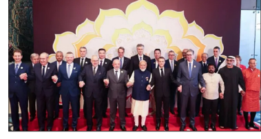
भारत के साथ मिलकर काम करें। इस एआई सम्मेलन ने स्पष्ट किया कि भारत की तकनीकी क्षमता से दिग्गज एआई कंपनियों प्रभावित हैं।

चूंकि भारत एआई में भविष्य देख रहा है, इसलिए भारत सरकार एआई पर निवेश को प्रोत्साहित कर रही है और इस कोशिश में है कि दुनिया भर की एआई कंपनियों