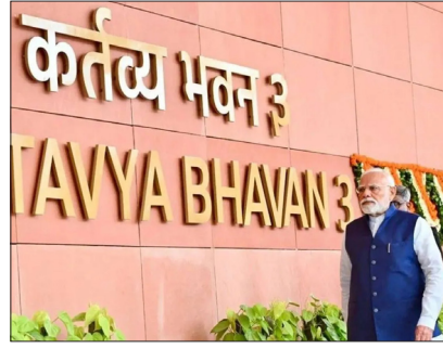
कार्यालय और मंत्रालय सेंट्रल विस्टा क्षेत्र में कई स्थानों पर बिखरे हुए और पुराने बुनियादी ढांचे से काम कर रहे थे। इस बिखराव के कारण परिचालन अक्षमता, समन्वय की चुनौतियां और रखरखाव की लागत अधिक थी। नए भवन इन मुद्दों का समाधान करते हुए प्रशासनिक कार्यों को आधुनिक, भविष्य के लिए तैयार सुविधाओं के

करेगा। यह कार्यक्रम दोपहर 1:30 बजे निर्धारित है। सेवा तीर्थ का पुराना नाम 'एजीक्यूटिव एन्क्लेव' था, जो अब नए नाम से प्रशासनिक कार्यों का केंद्र बनेगा। प्रधानमंत्री कार्यालय (PMO) के अलावा, 'सेवा तीर्थ' परिसर में राष्ट्रीय सुरक्षा परिषद सचिवालय और मंत्रिमंडल सचिवालय भी स्थित होंगे। आधिकारिक बयान के अनुसार, यह उद्घाटन भारत के प्रशासनिक शासन ढांचे में एक परिवर्तनकारी मील का पथर है और एक आधुनिक, कुशल और नागरिक-केंद्रित शासन