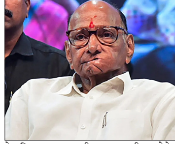
के लिए 12 फरवरी 2026 की तारीख लगभग तय हो चुकी थी। इस प्रक्रिया में शरद पवार गुट से

जयंत पाटिल और खुद अजित पवार सीधे तौर पर बातचीत कर रहे थे। शरद पवार ने अफसोस जताते हुए कहा, रघुबांग्य से अजित दादा की मौत ने इस प्रक्रिया को रोक दिया है। ऐसा लगता है कि अब यह प्रक्रिया रुक जाएगी।