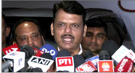
फडणवीस ने कहा, 'राकांपा उपमुख्यमंत्री के लिए जो भी फैसला लगे, सरकार और भाजपा उस फैसले का समर्थन करेगी।'

मुंबई. सुनेत्रा पवार को महाराष्ट्र का उपमुख्यमंत्री बनाए जाने की चर्चाओं के बीच शुक्रवार को मुख्यमंत्री देवेंद्र फडणवीस ने कहा कि भाजपा दिवंगत अजित पवार के परिवार और राष्ट्रवादी कांग्रेस पार्टी (NCP) द्वारा लिए गए फैसले का समर्थन करेगी। यहां केंद्रीय मंत्री नितिन गडकरी से मुलाकात के बाद पत्रकारों से बात करते हुए