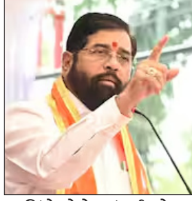
■ शिंदे बोले- मुंबई को विकास चाहिए

दरअसल, महाराष्ट्र में 29 म्युनिसिपल कॉर्पोरेशन के लिए 15 जनवरी को वोटिंग होगी है। इसका रिजल्ट 16 जनवरी को आएगा।