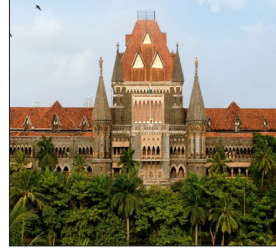
निर्विरोध चुनाव जीता। हाई कोर्ट से की थी सीधी जांच की मांग राज ठाकरे की पार्टी ने हाई