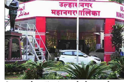
खिलाफ कोड ऑफ कंडक्ट तोड़ने के आरोप में सख्त कार्रवाई की जाएगी।

उल्हासनगर. मनापा चुनाव प्रचार के दौरान आचार संहिता उल्लंघन पर प्रशासन सख्त है। मनापा आयुक्त ने उल्हासनगर मनापा में एक इंचार्ज सैनिटेशन इंस्पेक्टर को तुरंत सस्पेंड कर दिया है, जिसने अपने पिता के कैंडिडेट होने का फायदा उठाकर खुलेआम प्रचार किया और अपने मोबाइल स्टेटस से अपनी पार्टी का रूख बताया। यह घटना राष्ट्रवादी कांग्रेस पार्टी की तरफ से पेश किए गए पत्रके सबूतों की वजह से सामने आई है और एडमिनिस्ट्रेशन के 'जीरो टॉलरेंस' वाले रूख को शहर में जोरदार चर्चा हो रही है। उल्हासनगर मनापा चुनाव के चलते प्रशासन ने बार-बार साफ चेतावनी दी थी कि अगर कोई भी अधिकारी या कर्मचारी सीधे या इन्-डायरेक्टली किसी कैंडिडेट के प्रचार में शामिल होता है, तो उसके