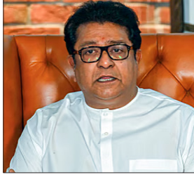
निर्विरोध चुने गए उम्मीदवारों के खिलाफ याचिका को हाई कोर्ट ने खारिज कर दिया है। मनसे नेता ने आरोप लगाया था कि पैसे और सत्ता के बल पर कई उम्मीदवारों ने