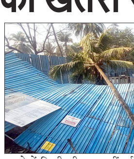
हादसे में किसी की जान नहीं गई। हालांकि, इस बात पर गंभीर सवाल उठ रहे हैं कि चल रही खुदाई के दौरान सुरक्षा के सही उपाय किए गए थे या नहीं। इस तरह के लापरवाही भरे कंस्ट्रक्शन से लोगों की सुरक्षा का सवाल एक बार फिर सामने आ गया है।

ठाणे. कोपरी पूर्व में जीजामाता रोड पर सर्वेक्ष सोसाइटी के नए कंस्ट्रक्शन के लिए चल रही खुदाई के दौरान मंगलवार सुबह करीब 9 बजे अचानक सड़क धंस गई। इस घटना से कंस्ट्रक्शन को बचाने के लिए बनाया गया शेड गिर गया, लेकिन एक बड़ा हादसा टल गया क्योंकि शेड सड़क पर नहीं गिरा बल्कि कंस्ट्रक्शन के अंदर गिर गया। इस समय, किनारे पर लगा नारियल का पेड़ भी गिर गया। लूकिए यह घटना सुबह के व्यस्त समय में हुई, इसलिए कुछ देर के लिए इलाके में अफरा-तफरी मच गई। कुछ देर के लिए लोग और ड्राइवर डर गए। अच्छी बात यह रही कि इस