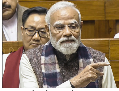
पीएम मोदी ने एक घंटे की स्पीच में वंदे मातरम् 121 बार, देश

पीएम ने कहा, उनके लिए इस गीत की ताकत बड़ी थी। फिर पिछले दशकों में इसके साथ इतना अन्याय क्यों हुआ। वंदे मातरम् के साथ विश्वासघात क्यों हुआ। वो कौन सी ताकत थी, जिसकी इच्छा पूज्य बापू की भावनाओं पर भी भारी पड़ी।