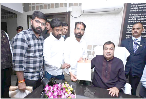
देशमुख ने केंद्रीय सड़क परिवहन और हाइवे मंत्री नितिन गडकरी से शहाड और वालधुनी दोनों

मनसे ने केंद्रीय मंत्री नितिन गडकरी से की अपील उल्हासनगर. मनसे ने केंद्रीय लोक निर्माण मंत्री नितिन गडकरी से मिलकर उल्हासनगर को जोड़ने वाले शहाड और वालधुनी पुलों के समांतर पुल बनाने की मांग की है। दोनों पुल पुराने हैं और उन्हें फिर से बनाने की मांग की जा रही है। नेशनल हाइवे नंबर 1 और उल्हासनगर और कल्याण शहर को जोड़ने वाले स्टेट हाइवे पर ट्रैफिक जाम की समस्या को देखते हुए, MNS के जिला अध्यक्ष बंडू