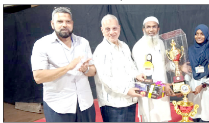
कल्याण, नासिक, मालेगांव, कोल्हापुर, इचलकरंजी, नांदेड, रायगढ़ एवं राज्य भर से आए प्रतिभाशाली छात्र-छात्राओं ने तार्किक, उद्देश्यपूर्ण और विचारोत्तेजक भाषणों के माध्यम से श्रोताओं को मंत्रमुग्ध कर दिया. भाषण प्रतियोगिता में कुल 47 स्कूलों