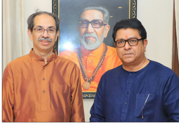
बन गई है। संजय का कहना है कि अब केवल गठबंधन की औपचारिक घोषणा बाकी है। रिपोर्ट्स के मुताबिक उद्धव-राज के बीच गठबंधन का ऐलान बुधवार दोपहर

मुंबई. शिवसेना UBT के नेता संजय राउत ने दावा किया है कि उद्धव-राज का गठबंधन वास्तव में अस्तित्व में आ चुका है। दोनों दलों के कार्यकर्ता मुंबई समेत राज्य के कई हिस्सों में मिलकर काम करने लगे हैं। संजय राउत ने कहा कि सोमवार रात दोनों पार्टियों के बीच सीटों के बंटवारे पर अंतिम सहमति