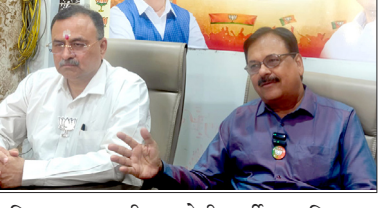
है कि अगर हमारी सहयोगी पार्टी शिवसेना टीओके के साथ चुनाव में