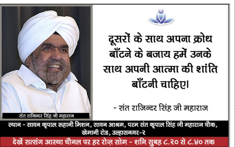
दूसरों के साथ अपना क्रोध बाँटने के बजाय हमें उनके साथ अपनी आत्मा की शांति बाँटनी चाहिए।

राष्ट्रपति पद की दौड़ से बाहर होने का दबाव बढ़ा। बाद में बाइडन पीछे हटने और अगली पीढ़ी को मशाल सौंपने के लिए राजी हो गए। उन्होंने तत्काल अपनी उप-राष्ट्रपति कमला हैरिस का नाम आगे कर दिया। उनकी पार्टी के लिए भी यह अच्छा निर्णय था। संकटग्रस्त व निराश डेमोक्रेटिक पार्टी तत्काल कमला हैरिस के पीछे एकजुट हो गई। यह तथ्य कि कमला ने चुनाव अभियान निधि में सिर्फ एक सप्ताह में 20 करोड़ अमेरिकी डॉलर जुटा लिए। साथ ही, 3,60,000 से अधिक स्वयंसेवकों ने उनके चुनाव में सेवा देने के लिए पंजीकरण करा लिया, इससे पता चलता है कि अमेरिकी जनता के बीच कमला हैरिस की एक अपील है। ऐसा लगता है कि डोनाल्ड ट्रंप से मुकाबले के लिए वह बिल्कुल तैयार हैं और उनके जीतने की उम्मीद है। अब ट्रंप की टीम हैरान है कि बाइडन के खिलाफ हमले के लिए उनके मुख्य मुद्दे गायब हो गए हैं- बड़ी उम्र, लचर स्वास्थ्य व कमजोर होती याददाश्त अब मुद्दे नहीं हैं। ट्रंप से तुलना करें, तो हैरिस लगभग 19 साल छोटी हैं, शारीरिक और मानसिक रूप से ज्यादा फिट हैं। इससे घबराए ट्रंप अभद्र भाषा का सहारा लेने लगे हैं। कमला के नाम, उनके रंग, उनकी जातीयता और भारतीय मूल पर सवाल उठा रहे हैं। ट्रंप यह साबित करने में लगे हैं कि कमला बड़ती चुनौतियों का मुकाबला करने में असमर्थ होंगी। वैसे ट्रंप की इन कोशिशों का विशेषज्ञ भी मजाक उड़ा रहे हैं। कमला हैरिस सार्वजनिक स्वास्थ्य देखभाल, गर्भपात अधिकार और