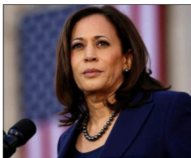
डोनाल्ड ट्रंप ने हरा दिया था। उसके बाद ट्रंप को बाइडन ने साल 2020 के चुनाव में हराया था और बाइडन 2024 में एक बार फिर मुकाबले को तैयार था। हालांकि, स्थितियां उनके अनुकूल नहीं थीं। 27 जून को ट्रंप के मुकाबले निराशाजनक टीवी बहस, 11 जुलाई को नाटो शिखर सम्मेलन में उनकी गलती, प्रमुख डेमोक्रेट नेताओं द्वारा उनके कमजोर स्वास्थ्य और जीतने की निराशाजनक संभावनाओं के चलते बाइडन पर

यह बात हैरान करती है कि दुनिया के सबसे पुराने लोकतंत्र, अग्रणी अत्याधुनिक प्रौद्योगिकियों के गढ़, जिसने दुनिया भर में अरबों लोगों को लाभ पहुंचाया है, उस अमेरिका में कभी कोई महिला राष्ट्रपति क्यों नहीं बनी? महिलाओं को नेतृत्व सौंपने में दक्षिण एशिया दुनिया में सबसे आगे रहा है। श्रीलंका में सिरिमावो भंडारनायके (1960) विश्व की पहली महिला प्रधानमंत्री बनीं। कुछ ही दशक बाद इंदिरा गांधी, बेनजोर भुट्टो (पाकिस्तान), खालिदा जिया और शेख हसीना वाजेद (बांग्लादेश) जैसी नेताओं को सत्ता संभालने का मौका एकाधिक बार मिला। भंडारनायके की बेटों भी राष्ट्रपति बनीं। यहां तक कि अमेरिका के कई नारी सहायोगी देशों, जैसे ब्रिटेन में मार्गरेट थैचर, टेरेसा मे