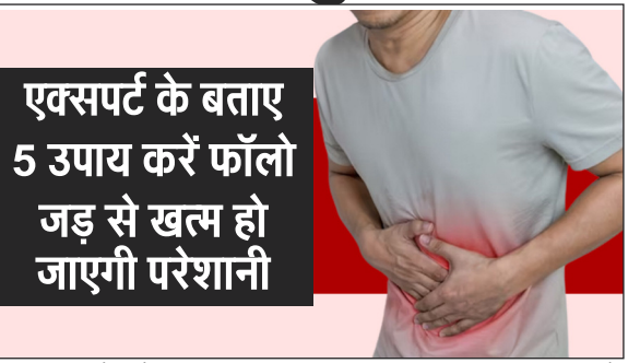
एक्सपर्ट के बताए 5 उपाय करें फॉलो जड़ से खत्म हो जाएगी परेशानी