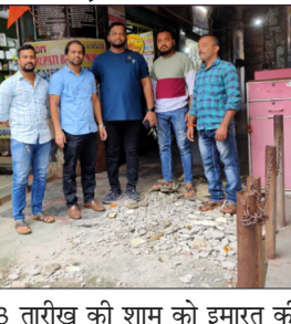
3 तारीख की शाम को इमारत की