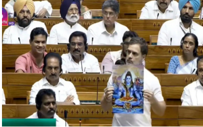
पर राहुल ने कहा कि क्या भगवान शंकर की फोटो दिखाना भी मना है? तब लोकसभा स्पीकर ओम बिरला ने कहा कि आपके ही साथी ने नियमों का हवाला दिया है। इसके मुताबिक सदन में किसी तरह के प्लेकार्ड की इजाजत नहीं है। इसके बाद राहुल गांधी ने यह बताया शुरू

राहुल गांधी ने सोमवार को संसद की कार्यवाही में भाषण दिया। इस दौरान उन्होंने भगवान शंकर की तस्वीर दिखाई। जब राहुल ऐसा कर रहे थे तभी स्पीकर ने उन्हें नियमों का हवाला देते हुए रोक दिया। इस