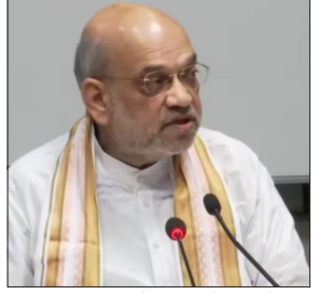
लाया गया। विधेयक को पहले ही कार्य मंत्रीगण समिति के पास भेजा जा चुका था।

गृहमंत्री के मुताबिक देशभर में 22.5 लाख से ज्यादा पुलिसकर्मियों को नए क्रिमिनल जस्टिस सिस्टम की ट्रेनिंग 12 हजार से ज्यादा मास्टर ट्रेनर्स ने दी है। लोकसभा में 9.29 बजे चर्चा हुई, उसमें 34 सदस्यों ने भाग लिया। राज्यसभा में 6 बजे से ज्यादा चर्चा हुई। इसमें 40 सदस्यों ने भाग लिया। शाह ने कहा कि यह भी झूठा कहा जा रहा है कि विधेयक को सांसदों को बाहर भेजे जाने (निर्लाभित किए जाने) के बाद