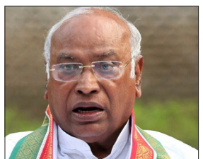
एक जनहित याचिका दायर की गई है। कांग्रेस के अध्यक्ष मल्लिकार्जुन खडगे ने कानून के लागू होने वाले दिन यानी एक जुलाई को एक्स (पहले ट्विटर) पर एक ट्वीट कर इन कानूनों की निंदा की है। खडगे ने एक्स पर एक पोस्ट में लिखा, 'रचनात्मक और नैतिक इच्छा के बाद मोदी जी और भाजपा वाले संविधान का आदर करने का खूब दिखावा कर रहे हैं, पर सच तो ये है कि आज से जो आपराधिक न्याय प्रणाली के तीन कानून लागू हो रहे हैं, वो 146 सांसदों को सस्पेंड कर जबरन

नई दिल्ली. भारतीय न्याय संहिता (बीएनएस) 2023, भारतीय नागरिक सुरक्षा संहिता (बीएनएसएसए) 2023 और भारतीय साक्ष्य अधिनियम (बीएसए) 2023 आज से भारत में प्रभावी हो गए हैं। मुख्य विपक्षी पार्टी कांग्रेस ने इन कानूनों की निंदा की है। भारत में इन तीनों नए आपराधिक कानूनों ने ब्रिटिश कालीन कानूनों भारतीय दंड संहिता (आईपीसी), दंड प्रक्रिया संहिता (सीआरपीसी) और भारतीय साक्ष्य अधिनियम की जगह ली है। तीन नए आपराधिक कानूनों को विपक्ष की आलोचना का सामना करना पड़ रहा है, क्योंकि विपक्ष का आरोप है कि इन्हें संसद में जबरन पारित किया गया था। कांग्रेस नेताओं ने इन कानूनों की निंदा करते हुए इन्हें असंवैधानिक और गैरजरूरी बताया है। सुप्रीम कोर्ट में भी इन तीनों कानूनों के खिलाफ