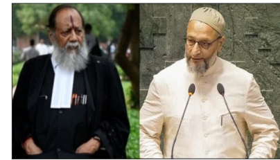
अयोग्य घोषित किया जाए।