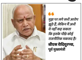
येदियुरप्पा, पूर्व कर्नाटक CM

से बात करते हुए उन्होंने कहा- मैं पूछताछ के लिए जा रहा हूँ। राज्य के लोग बहुत दिक्कत में हैं। ऐसे समय में पेट्रोल-डिजल के दाम बढ़ाना एक अपराध है। येदियुरप्पा ने रविवार को कहा था कि कुछ लोग कर्मचयून फेरौना चाहते हैं। मैं किसी पर आरोप नहीं लगाना चाहता। जबको सबकुछ पता ही है। इस साजिश के पीछे जो भी है, उसे जनता सबक