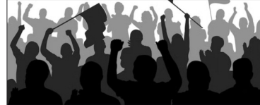
नीट यूजी 2024

ठीक उसी दिन सियासी गहमागहमी के बीच चुपके से घोषित कर दिया गया। इसके अलावा, पेपर लीक होने, इक्का-दुक्का की तुलना में 67 टॉपर्स होने, असंबंध स्कोर होने, करीब 1,500 छात्रों को ग्रेस मार्क्स दिए जाने, कट-ऑफ अधिक होने, एक ही कोचिंग सेंटर से आठ विद्यार्थियों के मेरिट लिस्ट में शामिल होने आदि के आरोप लगे हैं। राष्ट्रीय पात्रता सह प्रवेश परीक्षा (एनईईटी-नीट) भारत में स्नातक चिकित्सा कार्यक्रमों (एमबीबीएस और बीडीएस) में प्रवेश के लिए राष्ट्रीय परीक्षण एजेंसी (एनटीईए) द्वारा आयोजित की जाने वाली राष्ट्रीय परीक्षा है। यह परीक्षा भारत के अधिकांश मेडिकल कॉलेजों के लिए एकाग्र प्रवेश परीक्षा के रूप में आयोजित की जाती है। इनमें सरकारी और निजी, दोनों तरह के