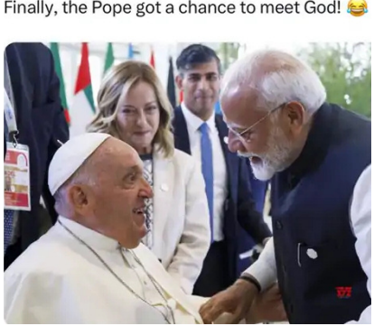
Finally, the Pope got a chance to meet God!

ली। केरल कांग्रेस ने स्टेटमेंट जारी कर कहा- ईसाई समुदाय की भावनाओं को हम ठेस नहीं पहुंचाना चाहते थे। हालांकि, PM की आलोचना से कांग्रेस को कोई हिचक नहीं है। भाजपा ने कहा- कांग्रेस ने ईसाइयों का अपमान किया भाजपा प्रदेश अध्यक्ष के. सुरेंद्रन ने X पर पोस्ट कर