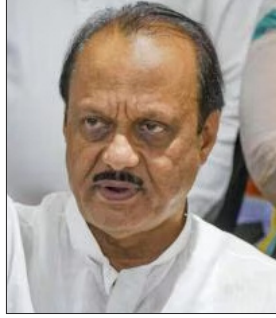
अग्नेजी अखवार से बातचीत में भाजपा के एक वरिष्ठ नेता ने कहा, 'आरएसएस-भाजपा कैडर पवार

स्वयं संघ यानी RSS ने मुखपत्र में पवार के साथ भाजपा के गठबंधन पर सवाल उठाए थे. न्यू इंडियन एक्सप्रेस की एक रिपोर्ट में सूत्रों के हवाले से लिखा है कि भाजपा नेतृत्व के एनसीपी तोड़ने और लोकसभा चुनाव से पहले अजित पवार गट्ट के साथ जाने से संघ खुश नहीं है. सूत्रों का कहना है कि भाजपा अजित से नाता तोड़कर मुख्यमंत्री एकनाथ शिंदे की अगुवाई वाली शिवसेना के साथ विधानसभा चुनाव के मैदान में उतर सकती है.