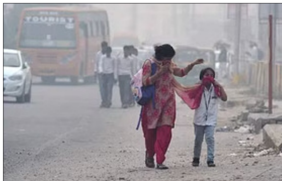
हवा की गुणवत्ता में सुधार के लिए सड़कों को धोना और उन पर धूल

उल्हासनगर. पिछले साल के आखिरी कुछ महीनों में मुंबई और उसके उपनगरों में हवा की गुणवत्ता बेहद खराब हो गई थी। हालांकि, नए साल की शुरुआत में भी यह बात सामने आई है कि ठाणे जिले के ठाणे, बदलापुर, उल्हासनगर, भिवंडी शहरों में हवा की गुणवत्ता में गिरावट आई है। केंद्रीय प्रदूषण नियंत्रण बोर्ड के रिकॉर्ड के मुताबिक, 1 जनवरी से 3 जनवरी के बीच विभिन्न शहरों में औसत वायु गुणवत्ता सूचकांक 180 से 300 के बीच है। तो नए साल की शुरुआत भी अशुद्ध हवा के साथ हुई है।