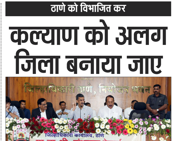
जिलाधिकारी कार्यालय, ठाणे शा.ना.श्री. शंभुराज देसाई