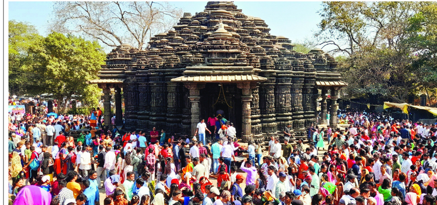
नव वर्ष के पहले दिन अंबरनाथ के प्राचीन शिवमंदिर में दर्शन के लिए भक्तों की भारी भीड़ रही.

इस समय राज्य और विदेश से लाखों मुस्लिम भाई और हिंदू श्रद्धालु दर्शन के लिए हाजीमलंग आते हैं. इस किले पर हजरत हाजी बख्तावर शाहबाबा की पहली दरगाह के पास एक 40 फीट लंबा पुल है, जिसके किनारे एक गहरी खाई है. नीचे पुल की सहारा देने वाले लोहे के खंभे पूरी तरह से जंग खाकर जर्जर हो चुके हैं। इसलिए स्थानीय लोगों का कहना है कि यात्रा अवधि के दौरान भीड़भाड़ के दौरान कोई बड़ा हादसा हो सकता है। इसलिए उनकी मांग है कि प्रशासन इस ओर ध्यान दे और जल्द से जल्द इस पुल की मरम्मत कराए.