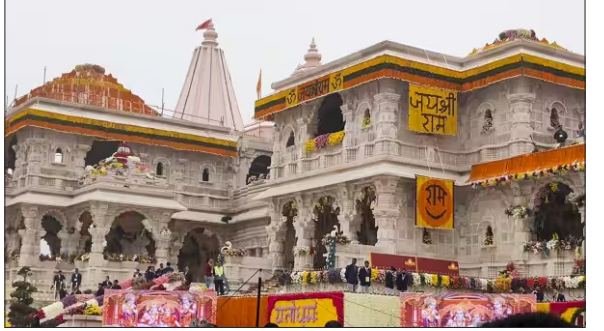
उस पर संत समाज का हक है। इस मंदिर को बनाने में इसलिए इतना वक्त लग गया कि संवैधानिक सिद्धांतों और लोकतांत्रिक प्रक्रिया के तहत किसी एक आस्था के पक्ष में एकतरफा फैसला करना किसी भी सरकार के लिए मुश्किल जान पड़ता था। हालांकि उसमें राजनीतिक नजरिया भी शामिल था।

वो अयोध्या में राम विग्रह की प्राण प्रतिष्ठा सौहार्द और उल्लासपूर्ण वातावरण में हो गई। इसके साथ ही लंबे समय से चला आ रहा विवाद भी समाप्त हो गया। राम भारतीय आस्था के प्रतीक हैं। पौराणिक प्रमाणों के अनुसार उनका जन्मस्थान उसी जगह को माना जाता है, जहां अभी भव्य मंदिर बना है। इसी जगह को लेकर करीब पांच सौ वर्षों से विवाद था। भाजपा की प्रमुख प्रतिज्ञाओं में से एक यह भी थी कि वह राम मंदिर का निर्माण राम के मूल जन्म स्थान पर ही कराएगा। इस तरह भाजपा की प्रतिज्ञा भी पूरी हो गई। विवाद इस बात को लेकर था कि राम मंदिर को ध्वस्त कर आक्रांता शासकों ने वहां मस्जिद खड़ी कर दी थी। उस जगह पर मालिकाना हक पाने के लिए संत समाज संघर्ष कर रहा था।