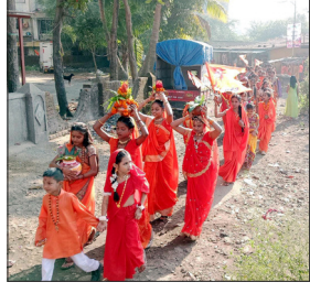
की और प्रसाद वितरण किया। शिव मंदिर में सुंदरकांड का पाठ-