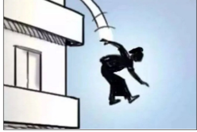
किया गया है।

ठाणे. ठाणे में एक 19 वर्षीय लड़की ने मानपाडा इलाके में 31वीं मंजिल से कूदकर अपनी जान दे दी. बताया जा रहा है कि लड़की कामकाज और पढ़ाई के लिए उत्तर प्रदेश से यहां आई थी। प्रारंभिक जानकारी के मुताबिक, युवती अपने गांव से शहर आने के बाद से ही खुश नहीं थी और संभवतः उसने यह चरम कदम उठाया। इस मामले में चितलखर थाने में आकस्मिक मौत का मामला दर्ज